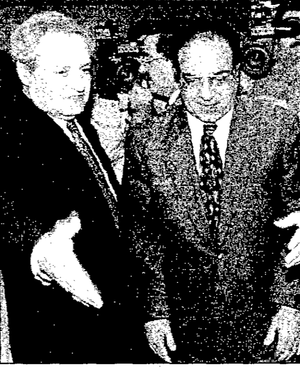
وزير الخارجية السعودي لقرن يربط بينه وبينه في لندن امس

واشنطن اكدت انها ما زالت واثقة في تعاون عسكري سعودي بالهجوم الامير سلطان: لم نبحت مع كوهين اي تسهيلات دبي - واشنطن - القدس العربي: وكان الوزير الاميركي اعلم في طريقه الى السعودية ان القوات الاميركية لن تحتاج لاستخدام القواعد السعودية في مجرمها للوقوف ضد العراق. ولكن الجنوب الاميركي لدى مجلس الامن ايل ريتشاردسون صرح بان واشنطن ما زالت واثقة في التحالف العسكري السعودي مع القوات الاميركية لشن الهجوم ضد العراق. واعتبر مراقبون ان واشنطن ما زالت تأمل في الحصول على دعم لوجيستي من طائراتها الموجودة في السعودية دون ان تشارك مباشرة في صفق العراق. وكان بيان سعودي اميركي صدر امس احتفاء كوهين مع الملك فهد بن عبد العزيز حذر العراق مجددا من عقوباته امتناعه عن تنفيذ قرارات مجلس الامن.